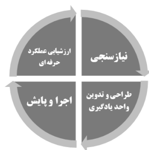
شکل شماره ۲: چرخه فعالیت کارآموزی

این فرایند شامل چهار مرحله است که عبارتند از: «نیازسنجی»، «طراحی و تدوین واحدهای یادگیری»، «اجرا و پایش» و «ارزشیابی عملکرد حرفه ای». شکل شماره ۱، چرخه فرایند کارآموزی را نشان می دهد: