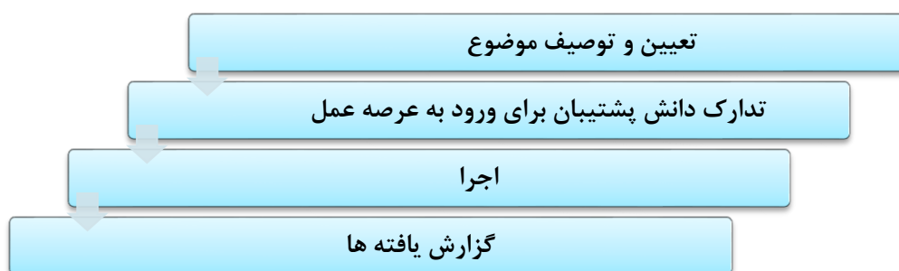
شکل شماره ۲: چرخه درس آموزش پژوهی در عرصه عمل

چرخه آموزش پژوهی ناظر به فرایند عمل و تامل بر آن عملی می‌باشد که مراحل آن در شکل شماره ۲، نشان داده شده است: